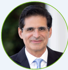
Senador Estatal Josh Becker Distrito 13